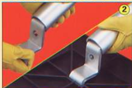
Ensamblar Ancla "Z" a Patin y Base.