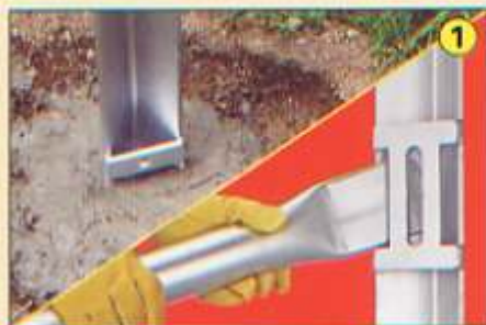
Cimentar Poste / Colocar Patin.