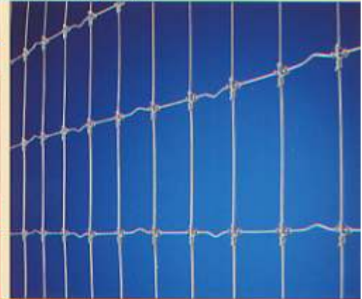
...y aun así conservar su diseño original.