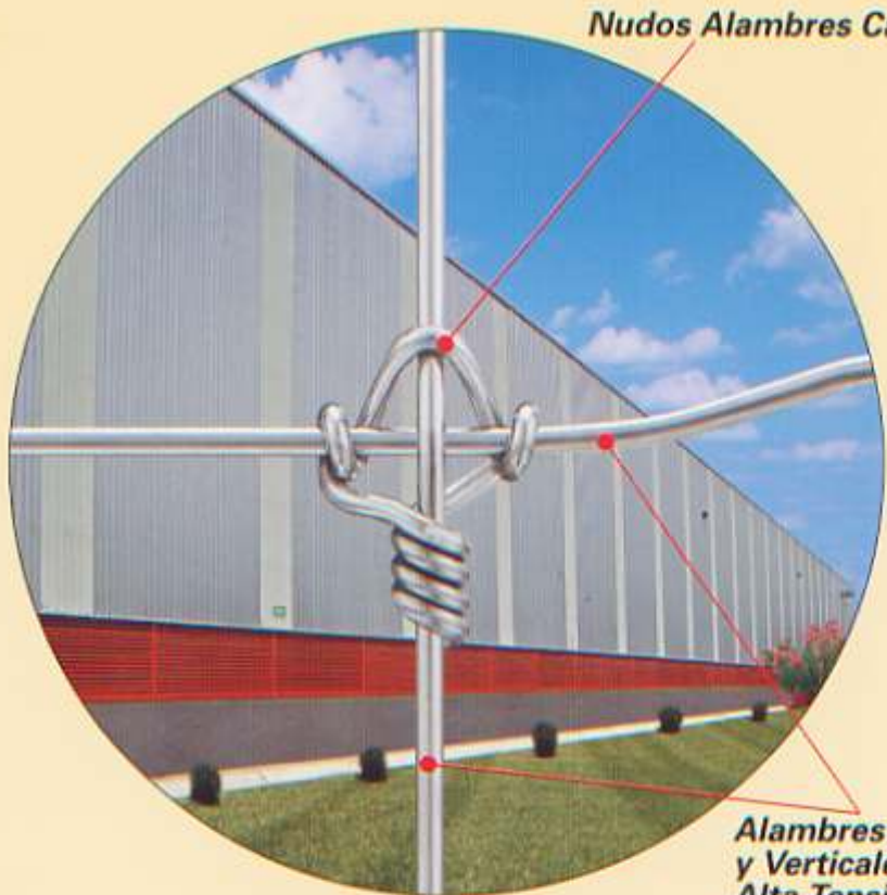
Nudos Alambres Cal. 13