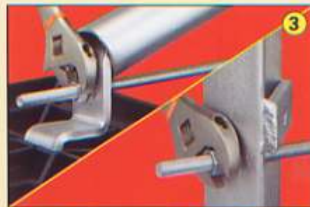
Pasar Tirante por Ancla y Poste y tensarlo ajustando tuercas.

100% Armables y Ligeras Fácil traslado e instalación