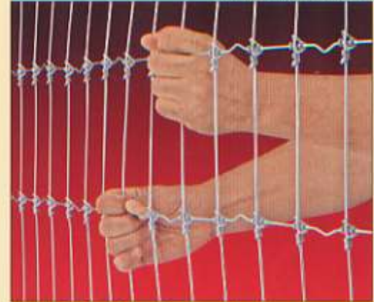
...resistir el maltrato de los transgresores...